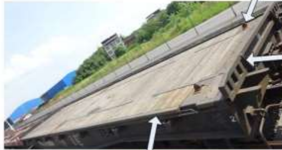
两用平车，确认端板 立起