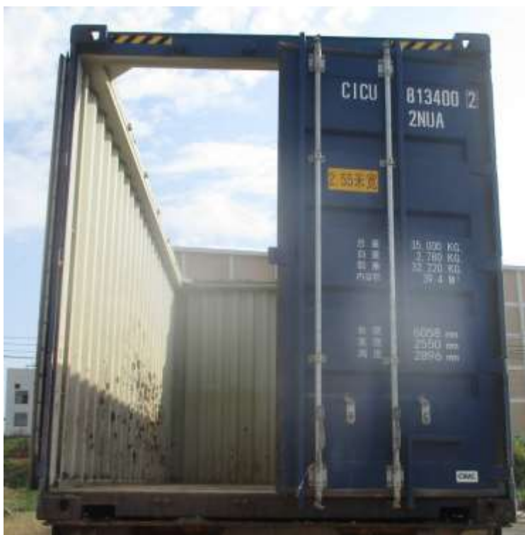
③第三张两扇箱门关闭加固好，反映集装箱装车前的状态。